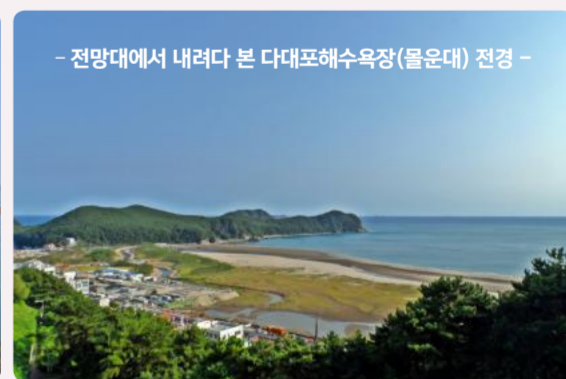
- 전망대에서 내려다 본 다대포해수욕장(물운대) 전경 -