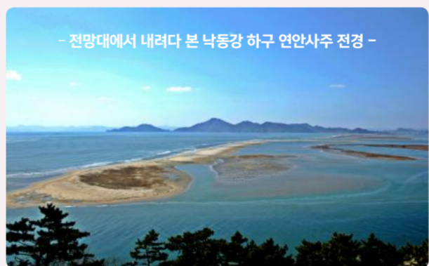
- 전망대에서 내려다 본 낙동강 하구 연안사주 전경 -

* 이용시간 09:00 ~ 18:00(월요일 휴관), 무료 ☎ 051-265-6863